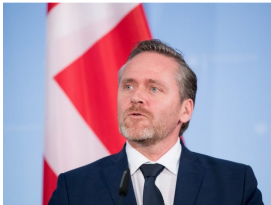
Nell'immagine, il ministro degli Esteri danese Anders Samuelsen

Fino ad oggi quindi, nonostante i numerosi cambiamenti dettati dalla storia, l'ambasciatore ha sempre avuto il compito di curare le relazioni tra il proprio paese ed un'autorità politica straniera. A questo ambasciatore "tradizionale" se ne aggiungerà presto un altro, almeno così è stato affermato dal ministro degli Esteri danese Anders Samuelsen, 49 anni ed in carica dal novembre del 2016 nel governo conservatore guidato dal premier Lars Lokke Rasmussen. Il ministro Samuelsen, in un'intervista a Politiken , il più influente quotidiano del regno, parlando a proposito di giganti della tecnologia quali Google, Apple, Facebook e Microsoft ha affermato come "queste compagnie si sono trasformate in una sorta di nuove nazioni; si tratta di aziende che hanno sulla Danimarca la stessa influenza di nazioni intere, e noi in qualche modo ci dobbiamo adeguare" 3 .